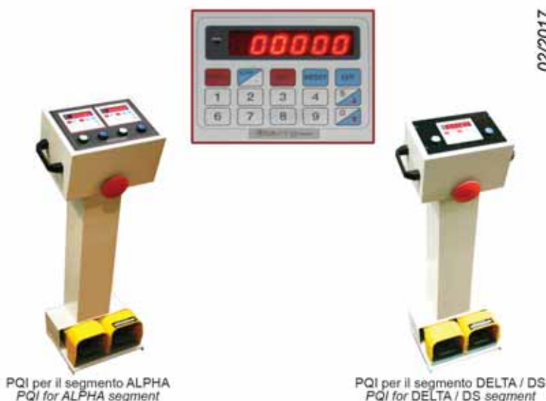
PQI per il segmento ALPHA PQI for ALPHA segment